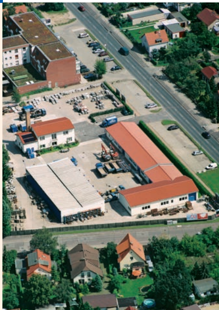
Luftbild des Unternehmenssitzes

ST 1958-2018 STRATIEF STRASSEN- UND TIEFBAU GMBH SEIT 60 JAHREN